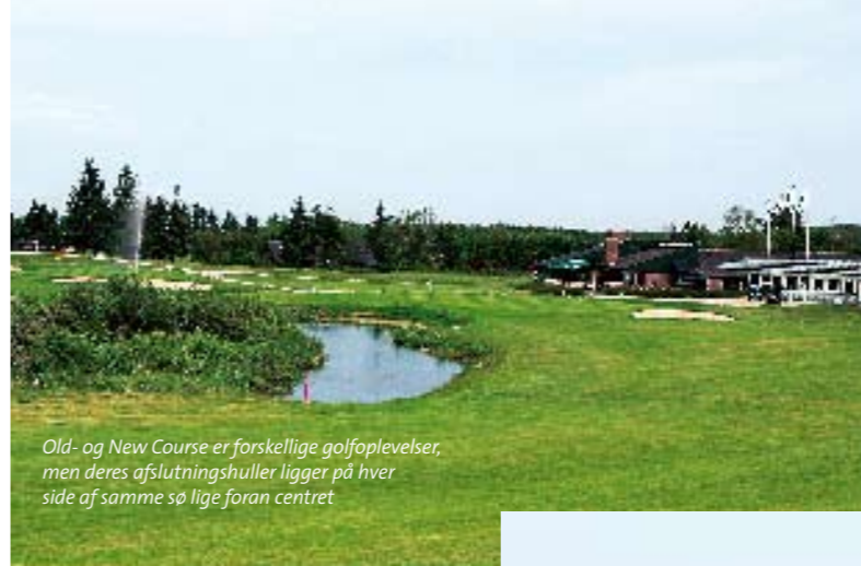
Old- og New Course er forskellige golfoplevelser, men deres afslutningshuller ligger på hver side af samme sø lige foran centret

NOGLE VIL FINDE OLD COURSE MERE INTIM OG HYGGELIG. ANDRE VIL FORETRÆKKE DEN STØRRE GOLFTTEST OG DE FLOTTE UDSIGTER, MAN FÅR PÅ NEW COURSE – SPECIELT GREENS ER UTROLIG GODE