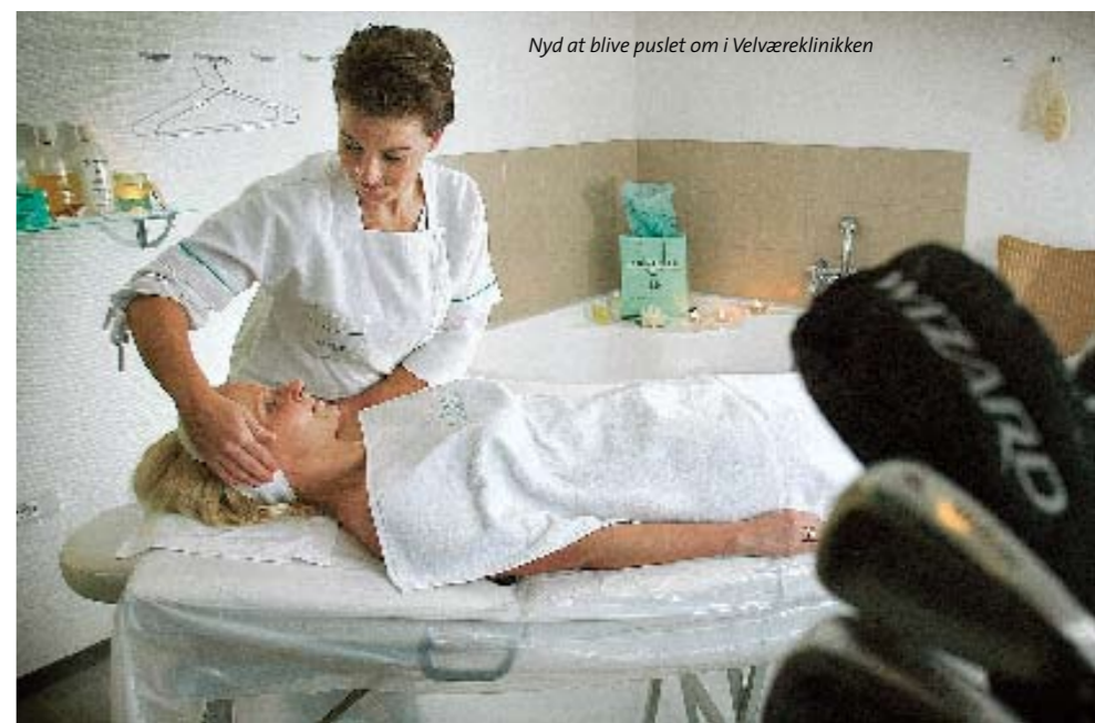
Nyd at blive puslet om i Velværeklinikken