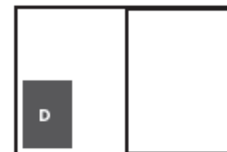
D 1/4 side format 76,5 x 112,5