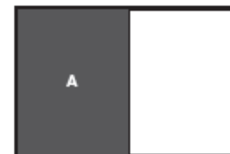
A 1/2 side format 189 x 245 (med beskæring 3 mm)