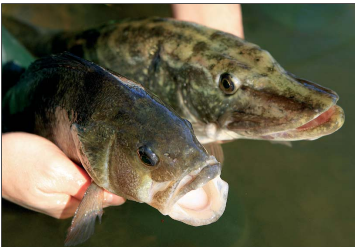
Mange af de mindre klit- og skovsøer rummer gode bestande af både aborre og gedder.