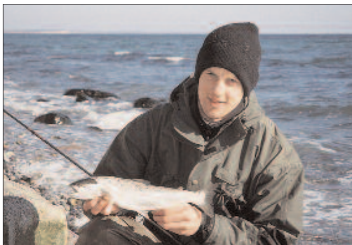
Området omkring Påø midt på øen er et spændende område for havørredfiskeren.

Torsk kan man også fange på dette stræk. I vinter månederne kan man fange dem om dagen, mens månederne fra marts til oktober fisker bedst i aften- eller morgentimerne. Hvis man har