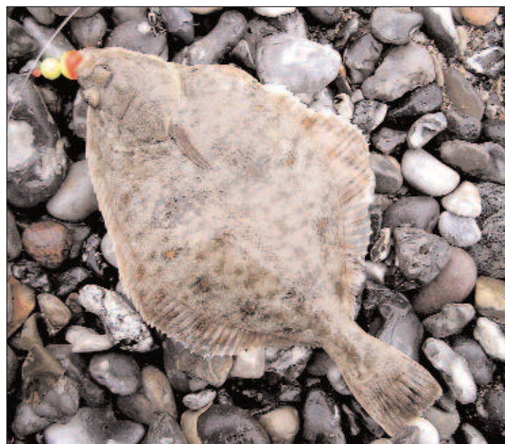
Langeland er bl.a. kendt for sit fiskeri efter fladfisk fra båd, men det kan også lade sig gøre at fange dem fra stranden.

man nu mod Lohals. Vejen følges gennem kuperet og idyllisk terræn gennem Tullebølle og videre nordpå. I Tranekær drejes der til venstre mod Strandby. Velankomet til kysten parkeres der på parkeringspladsen. Fiskeriet foregår