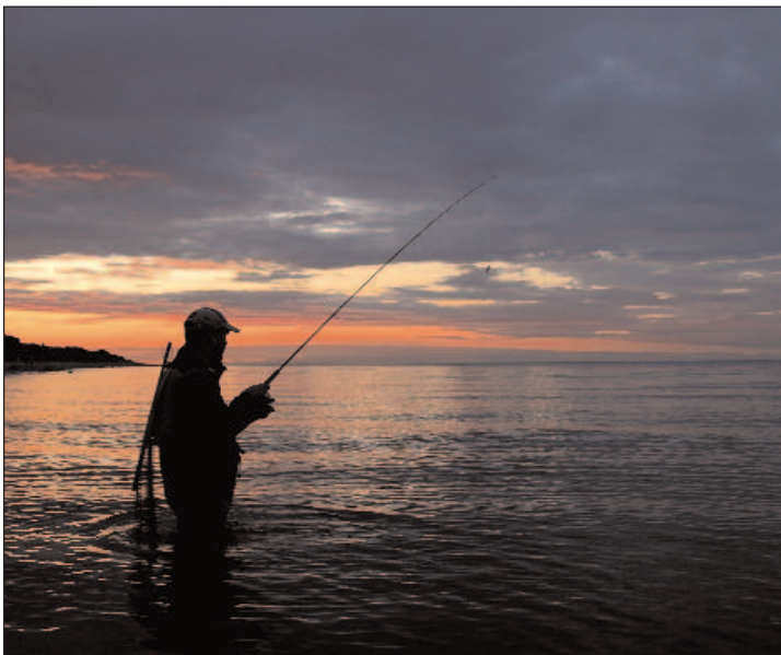
Området ved Keldsnor Fyr er rigtig spændende. Der er lavvandede områder med leopardbund, samt steder hvor man kan kaste langt og få torsk samt havørred på dybere vand.

VOGNSBJERG/KELDSNOR FYR er et smukt område, der kan byde på et forrygende fiskeri. Kyststrækningen ligger nord for de høje klinte og kan bedst nås, ved at fortsætte nordpå fra parkeringspladsen ved Dovns Klint. Der er tale om et flere kilometer langt indbydende stræk, som med fordel kan vadefiskes. Her er flere rev, og bunden er rigtig leopardpletet – dækket af blæretang, småsten og sandpletter. Havørreden trækker langs kyststrækningen, og ved vadefiskeriet kan man affiske mest muligt kystvand i jagten på den blanke skønhed. Her er gode be- ➔